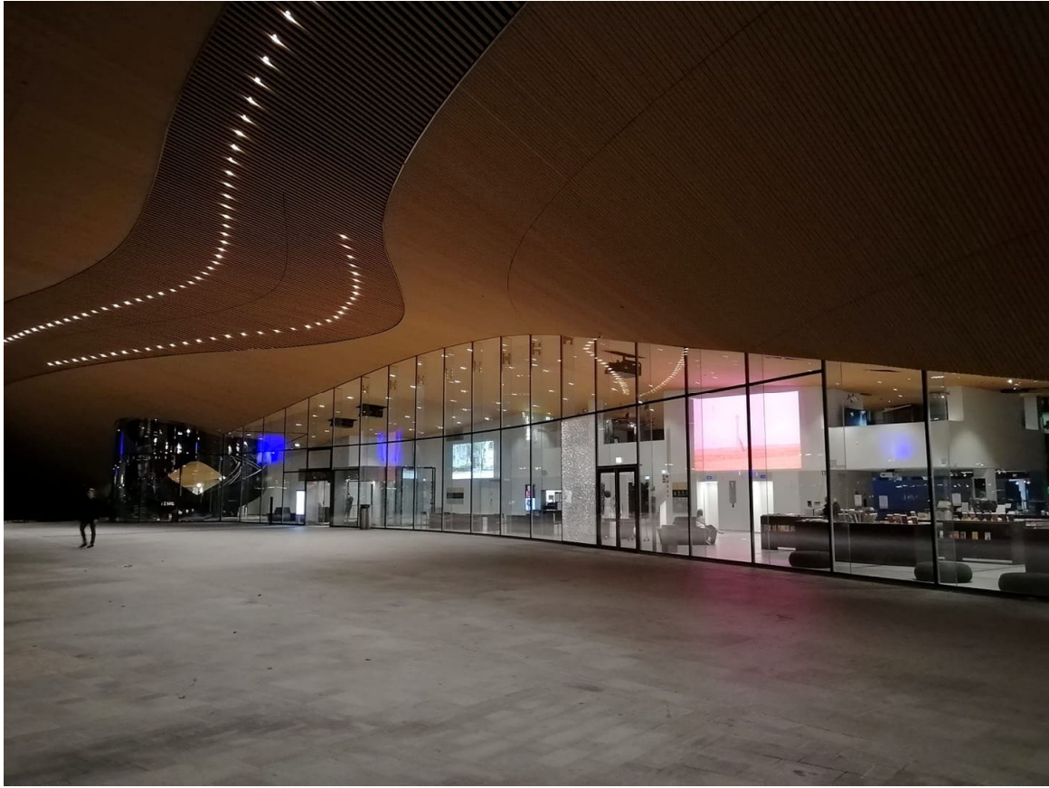
Oodi, Synthesis näkymää ulkoapäin